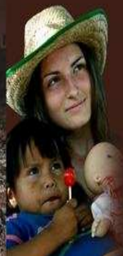
Foto k nahliadnutiu z uskutočnených 3 projektov http://bolivia.casd.sk/

Kde: Bolívia, Južná Amerika Kedy: 20.1. 2010 Doba trvania projektu: 21 dní